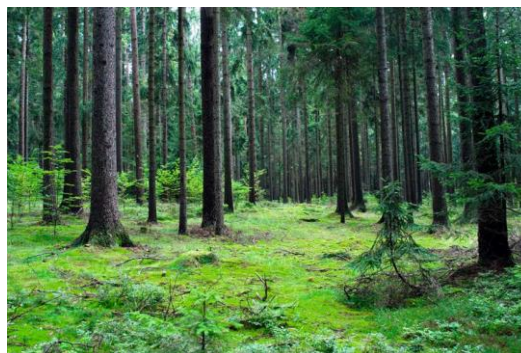
Bilde 2 Statskog SF

Til sammen utgjør det vernede og foreløpig båndlagte arealet på Statskogs grunn på Helgeland nå over 380 000 dekar. Dette utgjør ca. 19 % av det produktive skogarealet til Statskog, noe som representerer en stående kubikkmasse på omlag 690 000 m 3 som ikke er tilgjengelig for drift.